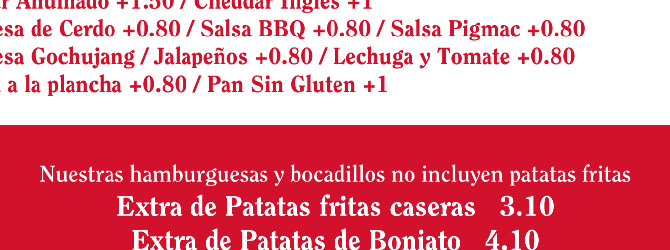
BC Burger Champion Burger by BestBurgerBcn