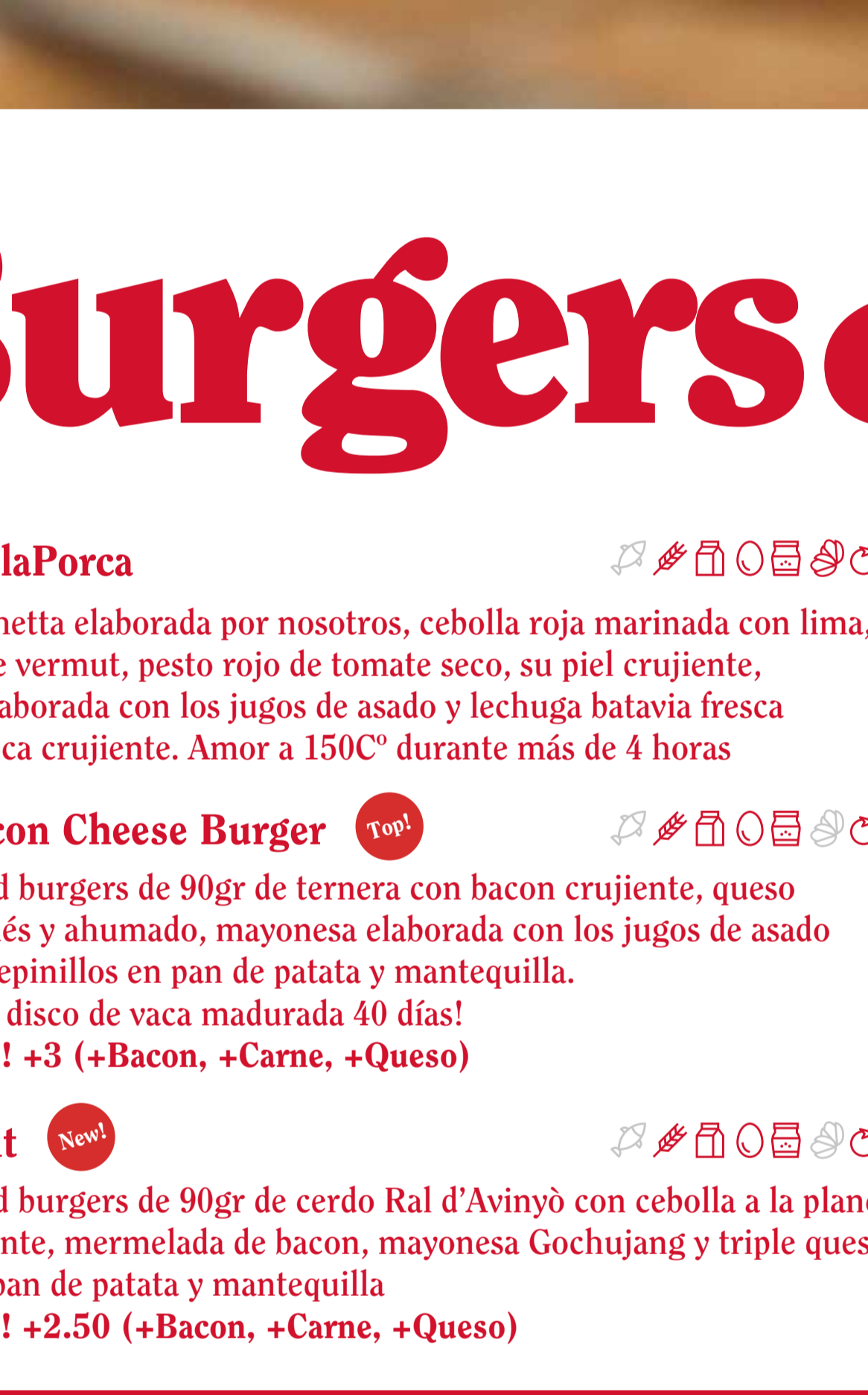
BC Burger Champion Burger by BestBurgerBcn